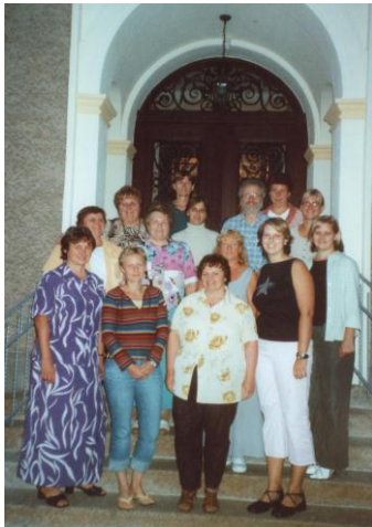
Mitglieder des Hornower und Kölziger Chores bei der Grillparty

Nicht nur zur Christlichen Gemeinde Ellmendingen pflegen wir freundschaftliche Beziehungen sondern auch zu Chören aus unserer Umgebung. So entwickelte sich Ende der 50er Jahre eine gute Zusammenarbeit mit dem Chor aus Eichwege und später zu dem Chor aus Kölzig. Wir unterstützen uns gegenseitig bei der Verstärkung des Chores zu besonderen Anlässen und treffen uns z. B. auch jährlich mit dem Kölziger Chor zum Grillen oder zur Weihnachtsfeier.