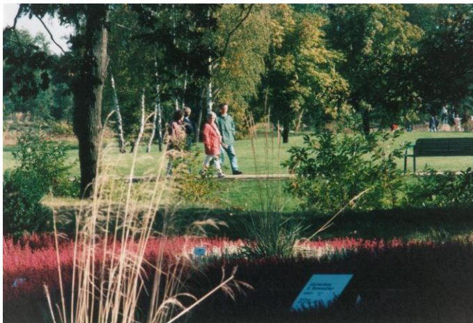
Buga in Cottbus 1995

In den 90er Jahren gab es wieder gegenseitige Besuche der Hornower und Ellmendinger. So waren wir ganz stolz darauf, unseren Gästen die damals in Cottbus stattfindende Bundesgartenschau zu präsentieren.