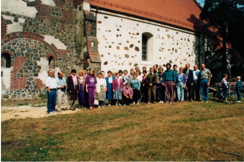
an der Hornower Kirche

Nicht nur zur Christlichen Gemeinde Ellmendingen pflegen wir freundschaftliche Beziehungen sondern auch zu Chören aus unserer Umgebung. So entwickelte sich Ende der 50er Jahre eine gute Zusammenarbeit mit dem Chor aus Eichwege und später zu dem Chor aus Kölzig. Wir unterstützen uns gegenseitig bei der Verstärkung des Chores zu besonderen Anlässen und treffen uns z. B. auch jährlich mit dem Kölziger Chor zum Grillen oder zur Weihnachtsfeier.