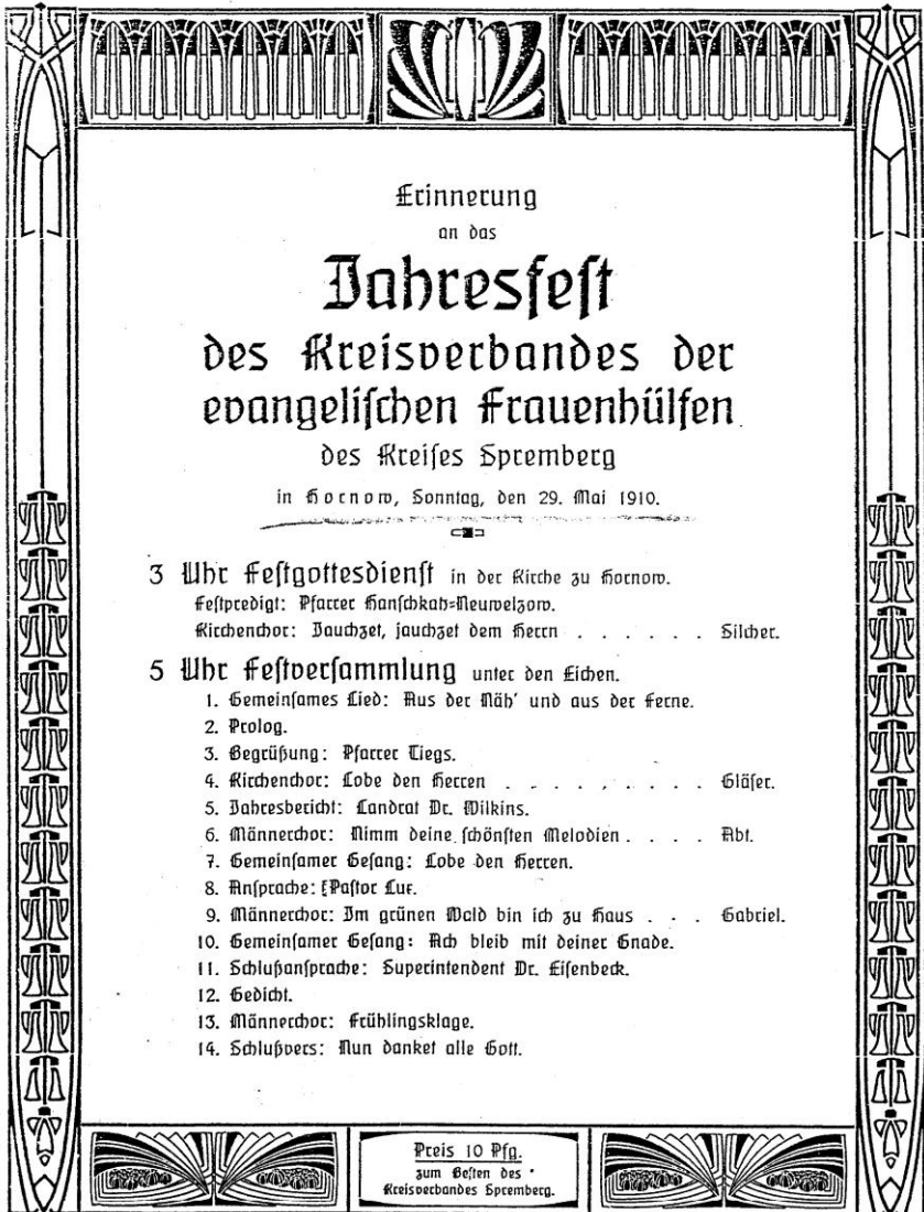
Originalprogramm von 1910

Der erste persönliche Kontakt war ein Besuch von Mitgliedern der Christlichen Gemeinschaft Ellmendingen in Hornow zu Pfingsten 1956. Fotos aus dem Jahre 1956 belegen, dass sie dabei u. a. den Rosengarten in Forst besuchten.